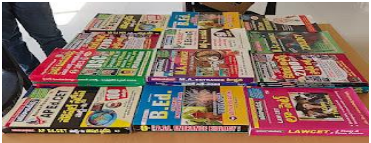
GDC KAMAVARAPUKOTA NEWS LETTER MARCH 2026